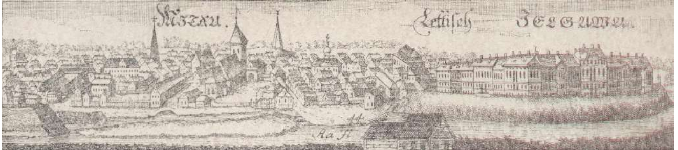
Jelgava 18. gs. vidū.

Kad 1561. gadā uz Livonijas ordeņa zemju lauskām izveidojās Kurzemes un Zemgales hercogiste, Jelgava ( Mītava, Mitau, Moitaw, Mitowie, Mintauja, Mumaa ) bija tikai viena no hercoga rezidencēm, kurā galms laiku pa laikam uzturējās. 1564. gadā hercoga Gotharda Ketlera un viņa līgavas Mēklenburgas princeses Annas laulību līgumā Jelgavas pils tikusi minēta kā atraitnes tiesa.