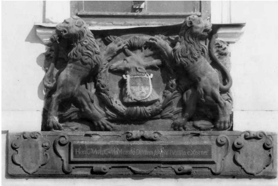
Cilnis ar Jelgavas pilsētas ģerboni virs rātsnama ieejas. 20. gs. 40. gadu sākuma foto. Uzraksts latīņu valodā "Hanc Urbis CVriaM gratia DIVina fo Veat IVstItia eXornet" (Lai Dieva labvēlība sniedz taisnību šai pilsētas valdei) ietver sevī arī romiešu ciparus, kas veido gadskaitli 1743, kad rātsnams tika pabeigts.

Krievijas impērijas laikā rāti joprojām veidoja 12 cilvēki, kurus tagad apstiprināja guberņas valde: divi birģermeistari (no tirgotāju un namnieku kārtām), no kuriem viens uz gadu paliek par prezidējošo, bet tad mainās vietām ar otru; divi fogti un astoņi rātskungi. Tirgotājus un amatniekus pārstāvēja vecāko sols ; to vecākie pārstāvji jeb eltermaņi bija pirmie kandidāti rātskungu vakanču ieņemšanā.